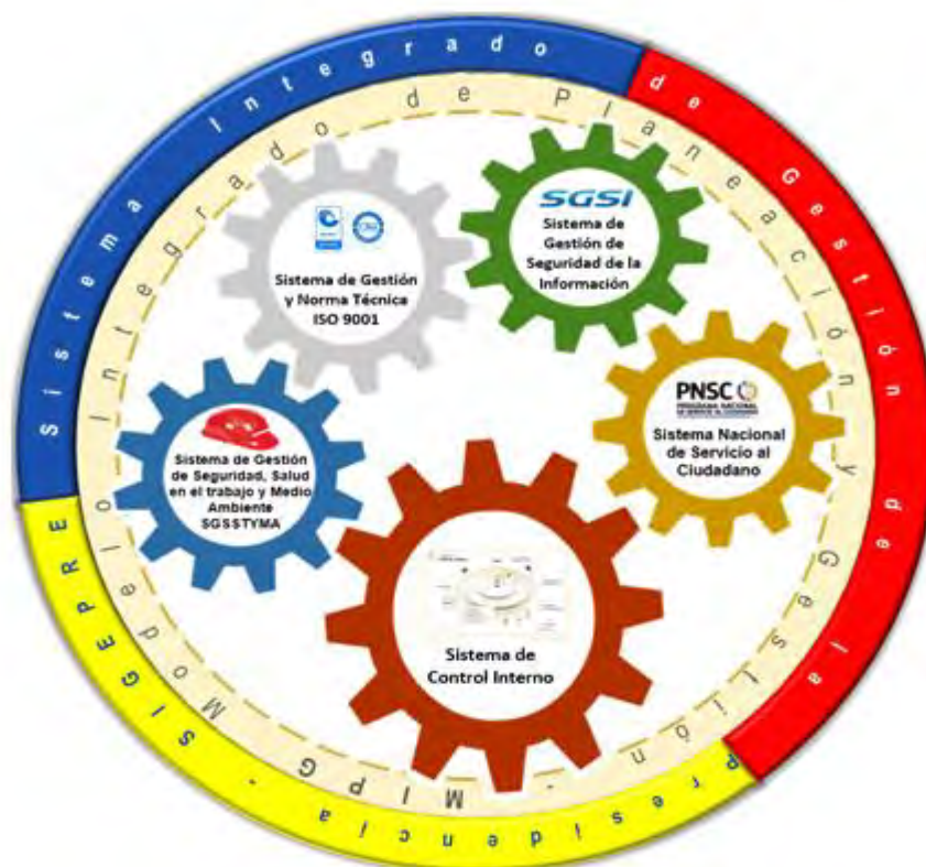
Gráfica 1: Modelos de gestión que conforman el SIGDISTRIS

DISTRISSEGURIDAD tiene implementado el Sistema Integrado de Gestión–SIG, el cual permite armonizar los procesos para propender por una gestión eficiente, eficaz y transparente, con el fin de aumentar la satisfacción de los clientes. La armonización del Programa de Gestión Documental se consolida gracias a la transversalidad de las actividades hacia toda la Entidad el cual se encuentra integrado por los siguientes modelos de gestión: